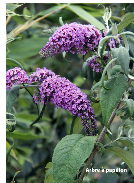
Arbre à papillon